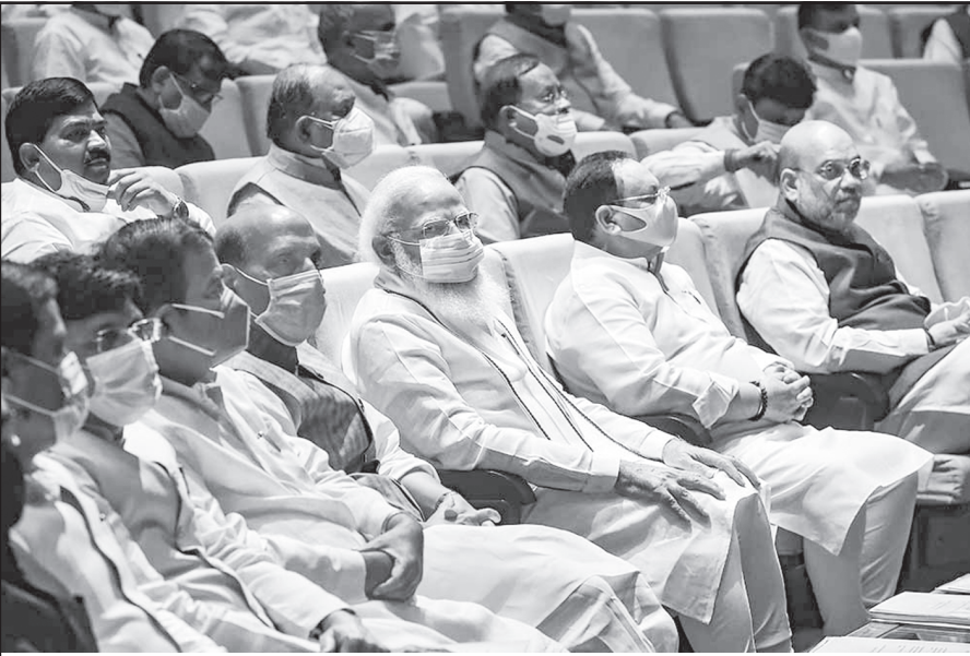
પાટનગર નવી દિલ્હીમાં ચાલી રહેલા સંસદના ચોમાસુ સત્ર દરમિયાન મંગળવારે સંસદ ભવન ખાતે યોજાયેલી ભાજપ સંસદીય દળની બેઠકમાં વડાપ્રધાન નરેન્દ્ર મોદી, રક્ષામંત્રી રાજનાથસિંહ, ગૃહમંત્રી અમિત શાહ, પક્ષ પ્રમુખ જે.પી. નડા તેમજ અન્ય નેતાઓ ઉપસ્થિત દેશ્યમાન થાય છે.

લોન લેનારા અનેક બેન્કોમાં ચાલુ ખાતુ ખોલાવીને ફંડની હેરાફેરી કરી રહ્યા હતા.