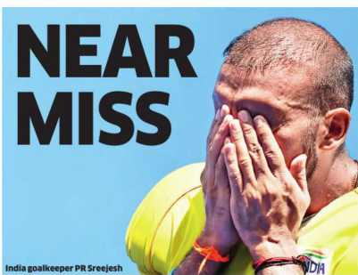
India goalkeeper PR Sreejesh

The Indian men's hockey team's dream of an Olympic gold after 41 years remained unfulfilled as it lost 2-5 to world champions Belgium in the last four stages but the side is still in the hunt for a bronze in the Tokyo Games on Tuesday.